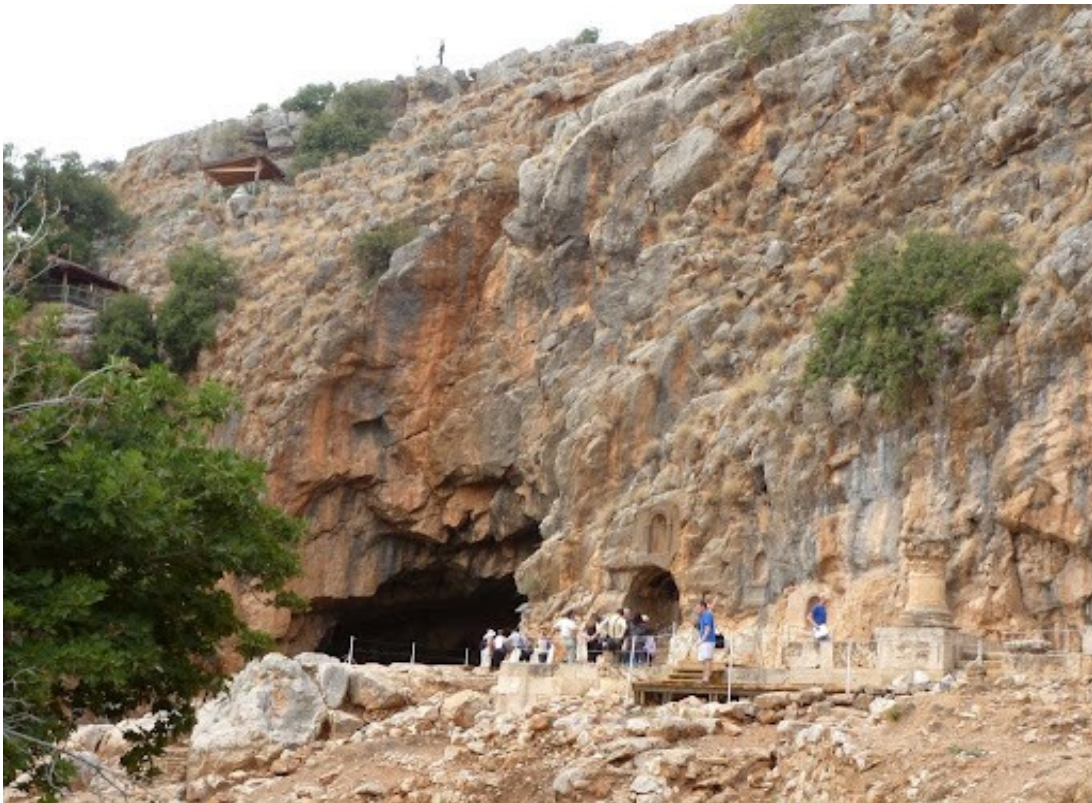
Grotte bei Cäsarea Philippi am Fusse des Berges Hermon.