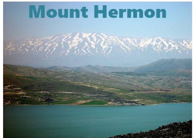
See Genezareth mit Hermon im Hintergrund

von Kanaan, Babylonien & Mesopotamien. Der Hermon überragt imposant mit einer schneebedeckten Kappe die gesamte Region von Nordisrael (Galiläa), Libanon und Syrien.